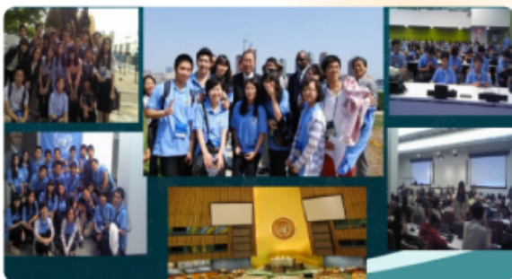
▲ Global Leadership UN Camp 글로벌 리더십 유엔 캠프 - 유럽