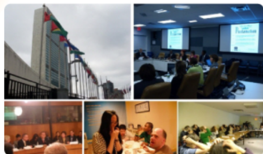
▲ World Youth Leadership Program - 미국