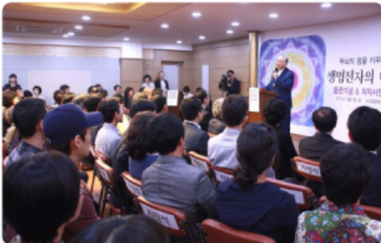
▲천안에 뇌교육 문화센터 개원